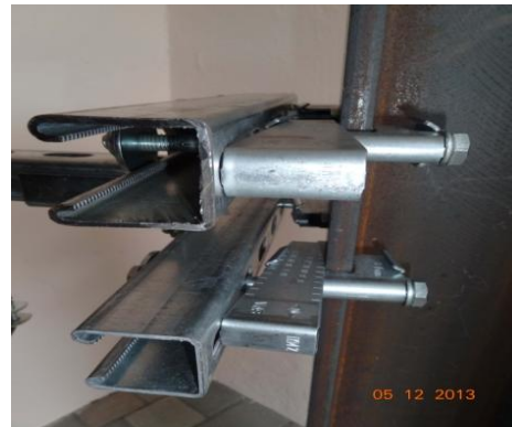
Le principe de raccordement