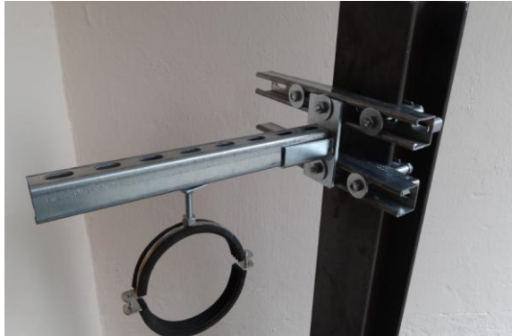
Bras de flèche pour des tubes, etc.