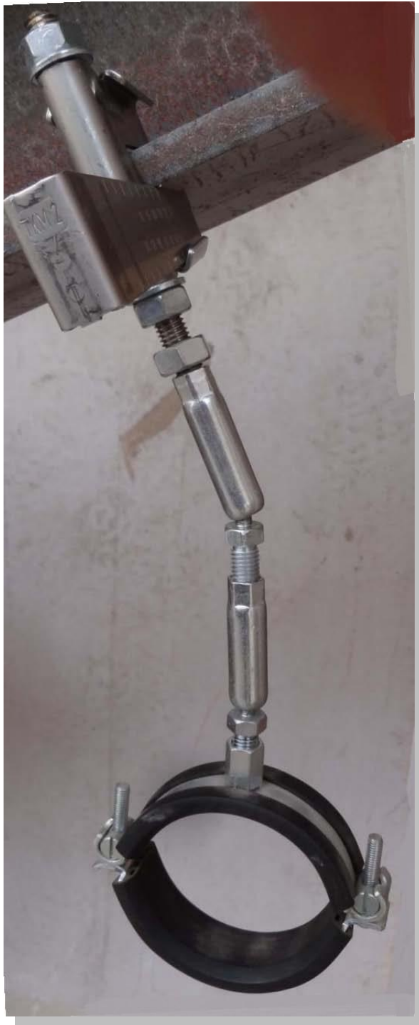
Collier de fixation en monté sur poutre métallique par ex. 30 degrés