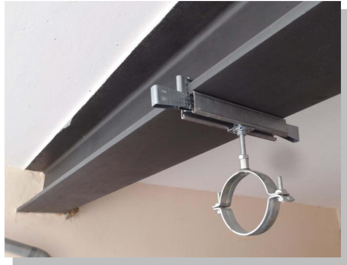
System de fixation massif, conform VdS ef FM