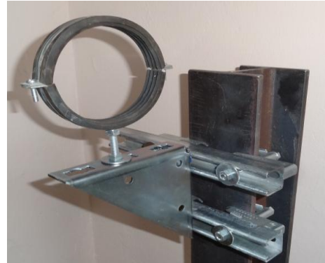
Montage d'une console