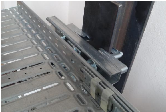
Fixation rapide d'un caniveau de câble